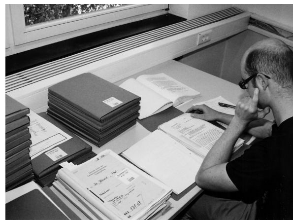
Benutzung der als Archivgut übernommenen Unterlagen der Zentralen Stelle im Lesesaal.