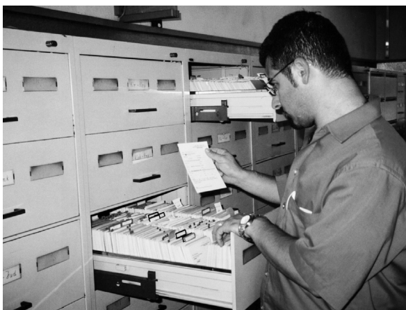
Recherchen in der sogenannten Zentralkartei werden von Archivmitarbeitern durchgeführt.

Auch die menschliche Tendenz, zurückliegende Ereignisse eher zu verklären und unliebsame Erinnerungen zu verdrängen, darf nicht unberücksichtigt bleiben, gerade wenn sich die Leitwerte zwischen dem Zeitpunkt des Erlebens und der Befragung diametral unterscheiden 24 . Eindeutige Richtlinien für die Abschätzung, was Tatsachen entspricht und was nicht, können hier nicht gegeben werden. Letztlich ist es doch der Histori-