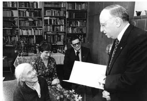
Kurt Hager, Sekretär des ZK der SED, überreicht Anna Seghers als Mitbegründerin der Akademie der Künste der DDR die Ehrenspange zum Vaterländischen Verdienstorden in Gold, 1980.