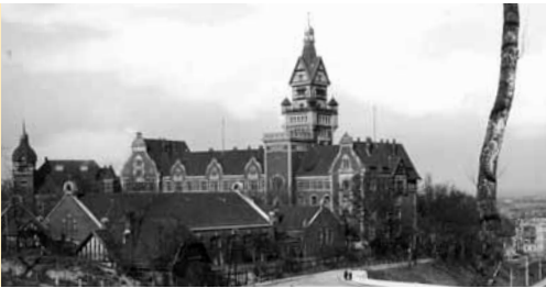
Das Reichsarchivgebäude auf dem Brauhausberg in Potsdam (B 145 Bild-P012380, Fotograf: o.Ang.).

Die Einrichtung eines zentralen Archivs wird durch die im Versailler Vertrag geforderte Auflösung zahlreicher militärischer Behörden bewirkt. Das Reichsarchiv übernimmt Unterlagen aller obersten Reichsbehörden seit 1867/71. Im Laufe der Zeit wird es um Schriftgut nichtstaatlicher Herkunft, fotografische und filmische Dokumente ergänzt. Das Heeresarchiv wird 1936 als selbstständige Einrichtung aus dem Reichsarchiv ausgegliedert.