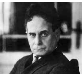
Maximilian Harden

Daneben sammelt das Bundesarchiv seit vielen Jahren historisch wertvolles Druckgut von Parteien, Verbänden, Vereinen und anderen gesellschaftlich aktiven Gruppen von reichs- und bundesweiter Bedeutung.