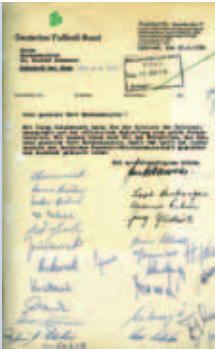
Die deutsche Fußballnationalmannschaft bedankt sich für die Glückwünsche von Bundeskanzler Adenauer zum Gewinn des ersten Spiels der Weltmeisterschaft 1958 (15.06.1958,)

Das Archivgut aus der DDR umfasst staatliche Unterlagen ebenso wie diejenigen der SED, des FDGB sowie anderer Massenorganisationen.