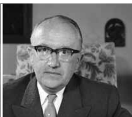
Walter Hallstein