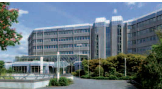
Bundesarchiv in Koblenz

Durch ein Verwaltungsabkommen werden dem Filmarchiv des Bundesarchivs im Verbund kinemathekarischer Einrichtungen die Aufgaben eines zentralen Filmarchivs für die gesamte deutsche Filmproduktion übertragen.