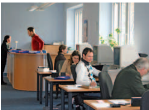
Mikrofilm-Lesesaal in Berlin-Lichterfelde

Zugang zu seinem Archivgut schafft das Bundesarchiv durch konventionelle Findmittel, eine Rechercheplattform mit Online-Beständeübersicht und Findbüchern einschließlich Digitalisaten, eine Bilddatenbank sowie einen umfangreichen Internetauftritt. Die Benutzung vor Ort ist während der Öffnungszeiten und unter Beachtung der im Bundesarchivgesetz festgelegten Bestimmungen jederzeit möglich. Das Archivgut wird außerdem in wissenschaftlichen Quelleneditionen und Ausstellungen zugänglich gemacht.