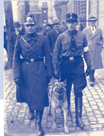
Nationalsozialistische Hilfspolizei geht gemeinsam mit Beamten der Schutzpolizei Streife in Berlin, 5. März 1933