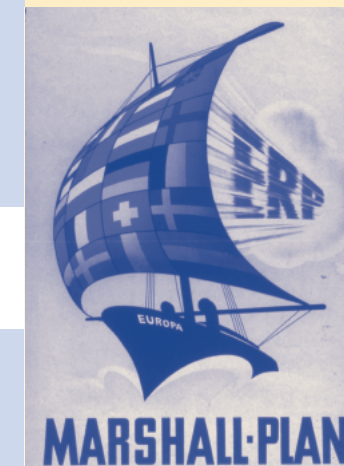
Werbeplakat für das European Recovery Program ERP, den sogenannten „Marshall-Plan“

Darüber hinaus stehen Plakate von der Kaiserzeit bis 1990 zu den Schwerpunkten Parteien und Verbände, Wahlen, staatliche Propaganda sowie Öffentlichkeitsarbeit von Behörden zur Benutzung bereit.