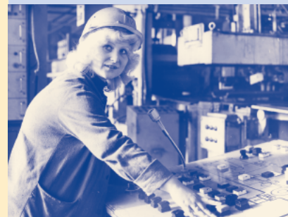
Vorbereitung des „Tags des Metallurgen“ 1976: Anlagenfaherin im VEB Kaltwalzwerk Bad Salzungen.