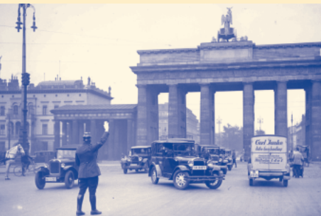
Polizist vor dem Brandenburger Tor, Mitte der 1930er Jahre