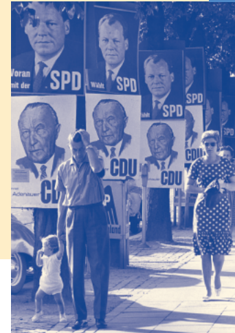
Bundestagswahlkampf 1961 in Bonn.