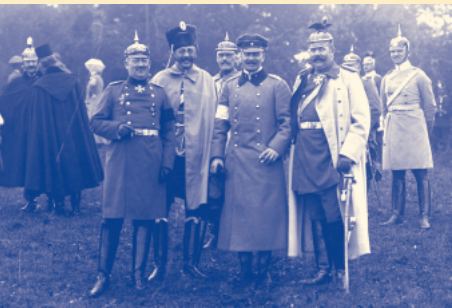
Kaisermanöver 1909, von links: Erbprinz Wilhelm von Hohenzollern, Erzherzog Franz Salvator von Österreich, Herzog Adolph Friedrich von Mecklenburg, Erzherzog Franz-Ferdinand von Österreich.