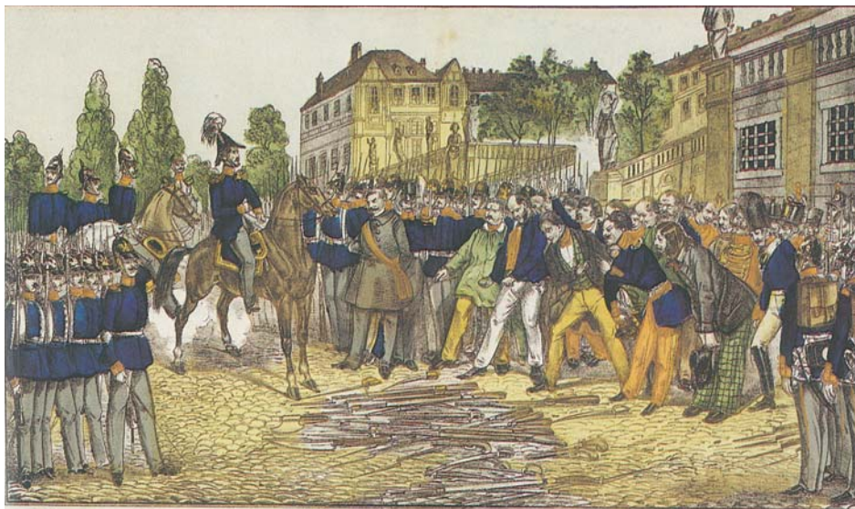
Entwaffnung der Revolutionäre 1849 in Rastatt (Badisches Landesmuseum Karlsruhe)