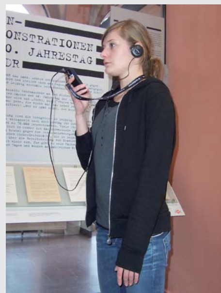
Audioguide im Einsatz

Die Beschaffung der Audioguides ist durch den Förderverein finanziert worden, der für diesen Zweck Drittmittel bei der Bundesstiftung zur Aufarbeitung der SED-Diktatur einwerben konnte. Produ-