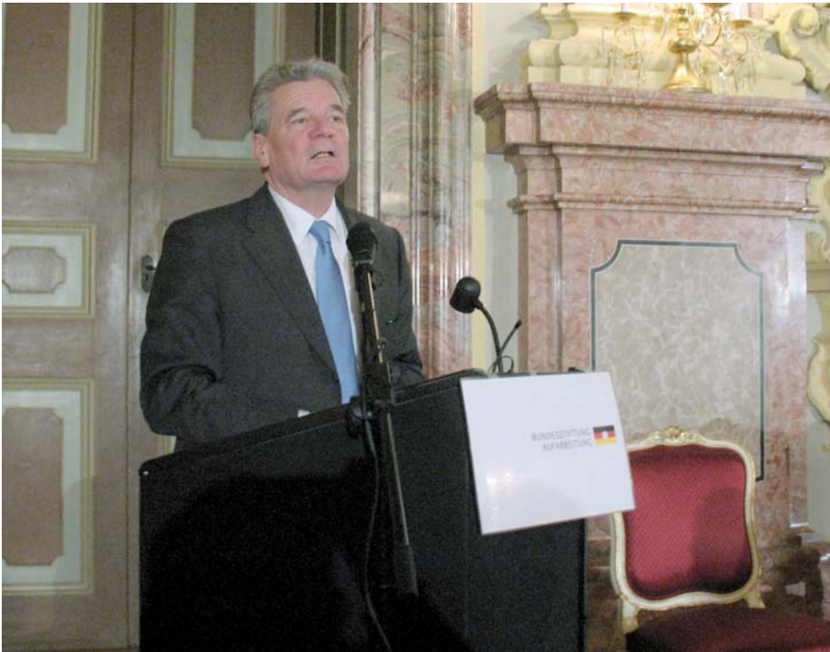
Joachim Gauck beeindruckte im Ahnensaal durch eine Verbindung von Analyse des DDR-Systems mit seinen persönlichen Erfahrungen.