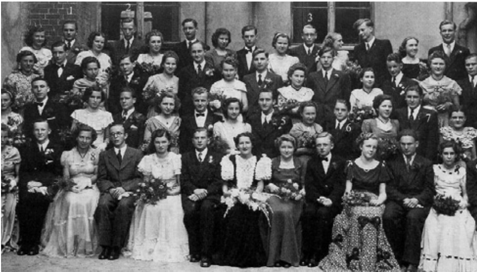
Tanzstundenabschlussball in Werda 1950.