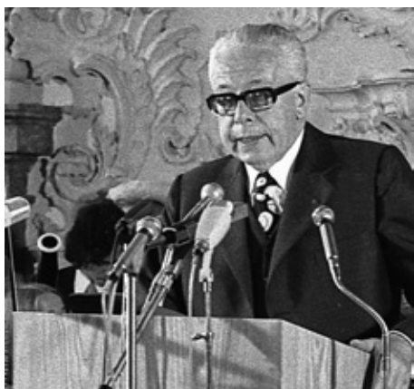
Gründungsvater der Erinnerungsstätte: Gustav W. Heinemann bei der Eröffnung der Erinnerungsstätte