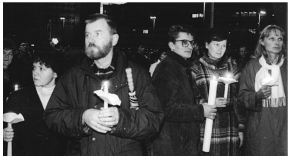
Teilnehmer der Montagsdemonstration in Leipzig 1989

Diskurs entfalten und artikulieren konnte, der schließlich zum Sturz Honeckers, zum Fall der Mauer und zur Wiedervereinigung führte. Fest steht auch, dass wir in den 40 Jahren DDR die verschiedensten Formen unangepassten Verhaltens finden: von stillem Rückzug ins Private über aktive Verweigerung, Ungehorsam und