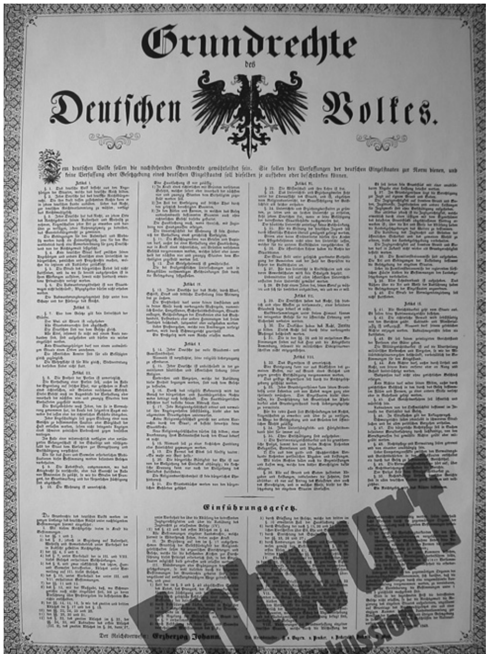
Die Grundrechte des deutschen Volkes von 1849 als Diskussionsgrundlage in der Friedlichen Revolution von 1989 Bildgestaltung und Bildgeber: Manfred Butzmann, Potsdam

Die Parallelen zwischen beiden Revolutionen sind offensichtlich: „Wir sind das Volk“ skandierten 1989 selbstbewusste Bürger auf den Straßen in Leipzig, Berlin, Dresden und anderswo und brachten damit den SED-Staat zu Fall. Unter der Parole „Wir sind das Volk“ schlossen sich im Sommer 1849 selbstbewusste