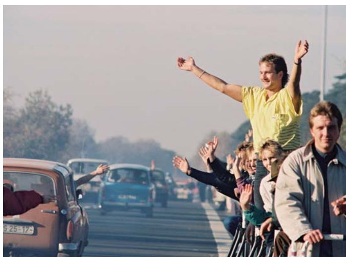
Einreisende DDR-Bürger werden am 11. November 1989 am Grenzübergang Helmstedt/Marienborn von Passanten begrüßt.

Vor 20 Jahren, im Sommer 1989, begann die rasante Erosion des kommunistischen Ostblocks. Hatte Erich Honnecker im Januar verkündet, die Berliner Mauer würde noch in 50 und 100 Jahren stehen, durchtrennten schon fünf Monate später, am 27. Juni, die Außenminister von Österreich und Ungarn, Alois Mock und Gyula Horn, den Stacheldraht an der österreichisch-ungarischen Grenze und öffneten damit demonstrativ den Eisernen Vorhang, der 40 Jahre lang die Völker Europas voneinander getrennt hatte. Am 9. November fiel die Mauer in Berlin, und die in den Westen strömenden DDR-Bürger wurden mit triumphalem Jubel begrüßt. Nur ein Jahr später waren die beiden deutschen Staaten vereinigt.