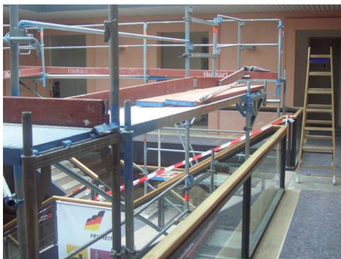
Renovierungsarbeiten in der Erinnerungsstätte im Juni 2009.

Das Bundesarchiv nimmt den 20. Jahrestag des Mauerfalls zum Anlass, um in der Erinnerungsstätte einen neuen Schwerpunkt zu verankern. Bislang bildeten die Freiheitsbestrebungen des 19. Jahrhunderts den einzigen Schwerpunkt der Dauerausstellung. Am 4. November wird ein zweiter Schwerpunkt hinzukommen: Die Freiheitsbewegungen in der DDR zwischen 1945 und 1989. Die Vorbereitungen dafür laufen auf Hochtouren. In den vergangenen Monaten wurde das Ausstellungsdrehbuch in konkrete Ausstellungstexte übersetzt und mit Fotos, Dokumenten und ausgewählten Exponaten angereichert in eine Ausstellungs-