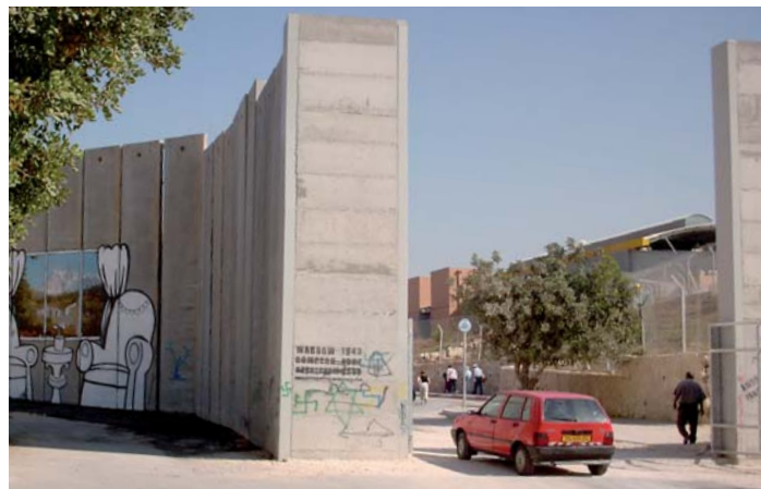
Die Trennmauer von Bethlehem vor der Vollendung.