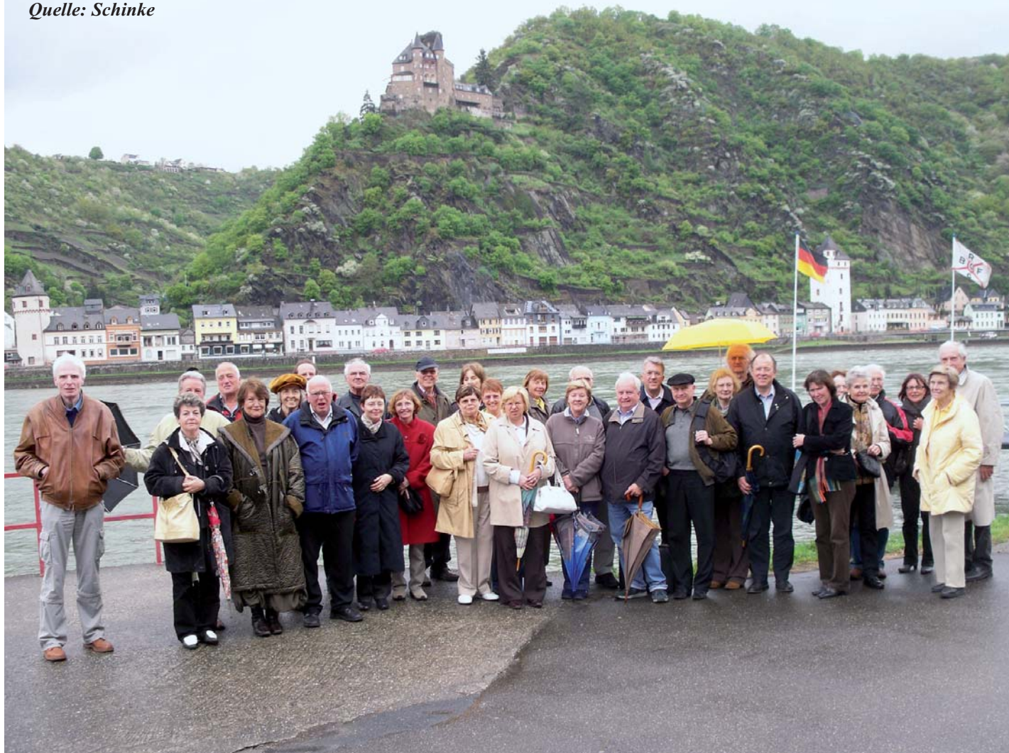
Vor der Rheinschiffahrt an der Anlegestelle in St. Goar.

Bei der Ankunft in Karlsruhe und Rastatt waren sich die mitreisenden Mitglieder des Fördervereins wie jedes Jahr einig, dieser erlebnisreiche Exkursionstag ging wieder einmal viel zu schnell vorüber. Schinke