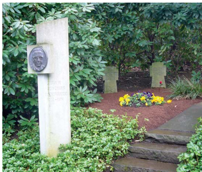
Grab von Hilda und Gustav Heinemann auf dem Friedhof in Essen