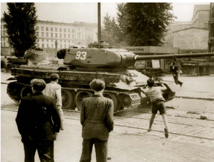
Widerstand. Ein Junge schleudert in Ost-Berlin am 17. Juni 1953 einen Stein gegen einen Panzer.