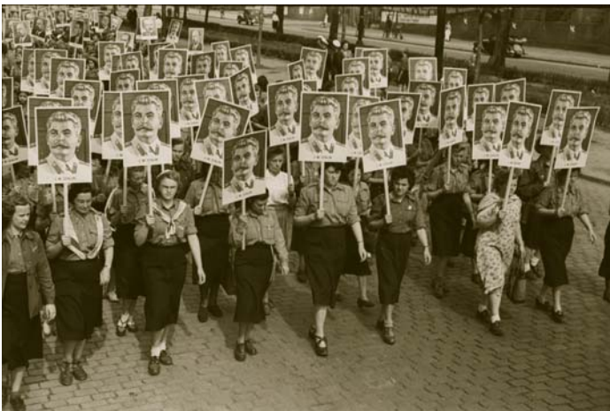
Konformität. Junge FDJlerinnen tragen das Porträt Stalins bei der Demonstration am „Tag der jungen Mädchen“ am 9. August 1951.