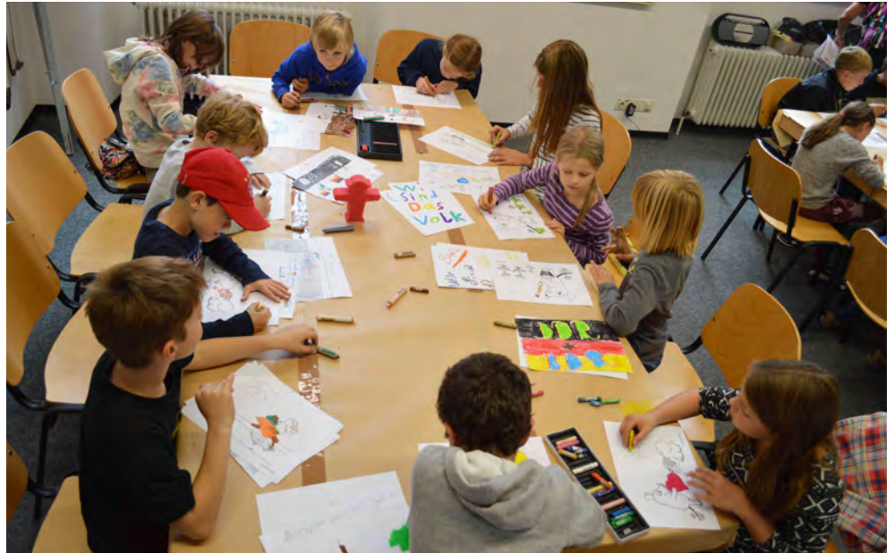
Ihre Eindrücke verarbeiteten die Kinder in Bildern – auch Mausbilder durften am Türöffnertag der Sendung mit der Maus natürlich nicht fehlen.