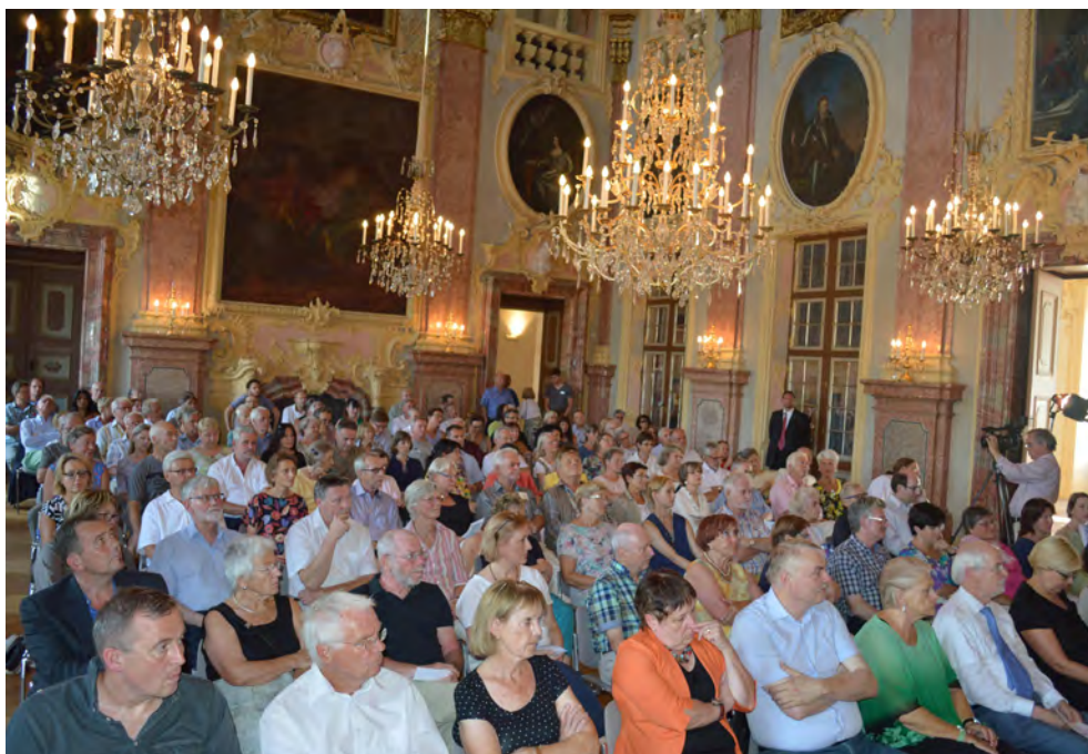
Das Publikumsinteresse an dem Urgestein des deutschen Politjournalismus war enorm.