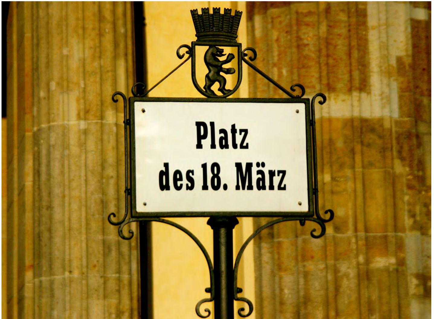
Platz des 18. März am Brandenburger Tor in Berlin.

Fahrt des Fördervereins vom 17. bis 20. März 2016