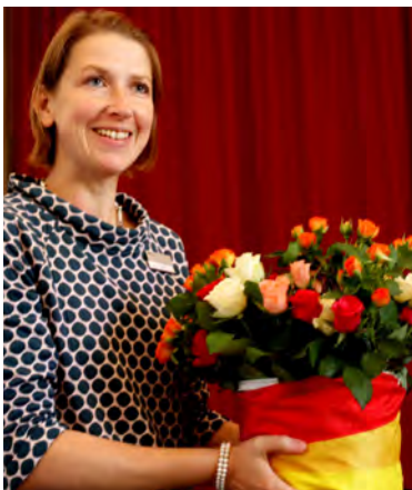
Jeder Gast erhielt eine Rose, um sie in Erinnerung an die mutigen Männer und Frauen der Revolution von 1848/49 am Denkmal niederzulegen oder mit nach Hause zu nehmen.