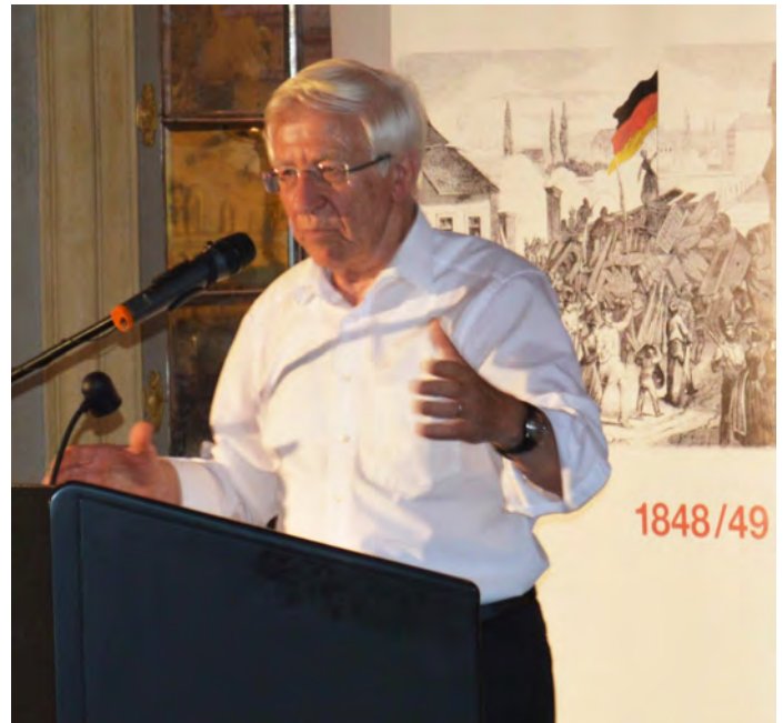
Franz Alt engagiert sich seit Jahren für die Nutzung alternativer Energien.

Der promovierte Politikwissenschaftler, der in diesem Jahr seinen 77. Geburtstag feierte, ist seit Jahren leidenschaftlicher Fürsprecher der Solarenergie und Vorkämpfer des Energiewandels. Alt mahnte eindringlich, dass es eine „Überlebensfrage der Menschheit“ sei, dass dieser gelinge. Die Energiekrise sieht er als Dreh- und Angelpunkt aller krisenhaften Erscheinungen, die Europa und die Welt derzeit in Atem halten. So sei die Ukraine-Krise im Kern nichts