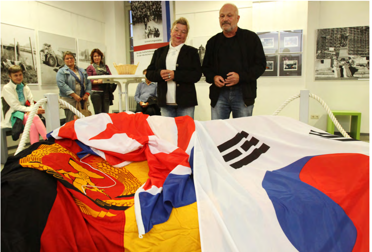
Performance bei der der Vernissage: das Künstlerpaar wies auch auf die Trennung von Nord- und Südkorea hin.