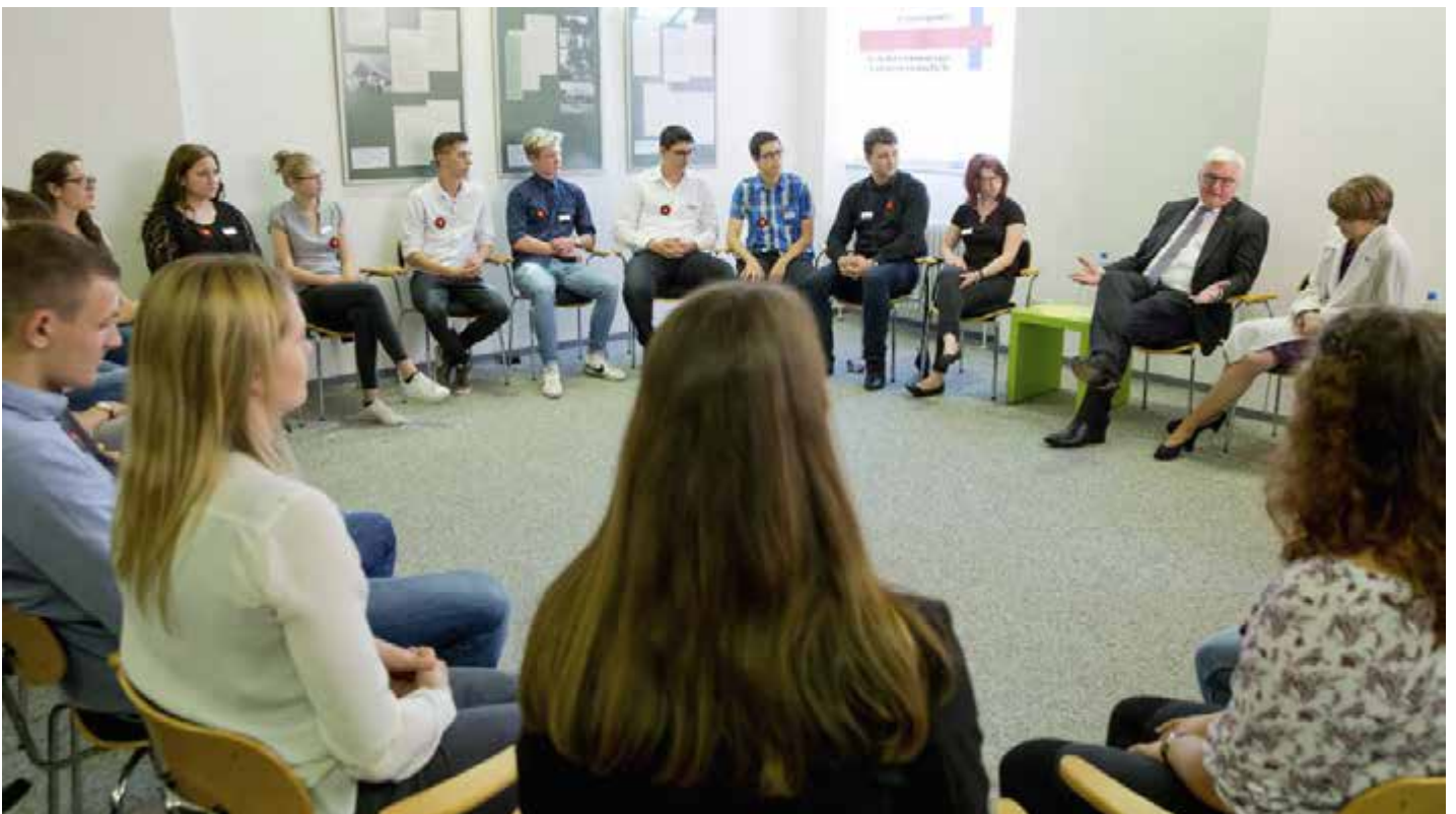
Bundespräsident Frank-Walter Steinmeier und seine Frau Elke Büdenbender im Gespräch mit Schülerinnen und Schülern.

mokratie in der DDR vor dem Volksaufstand am 17. Juni 1953 war. So forderte die Belegschaft eines Betriebes in einer „Resolution“ freie Wahlen. Auf einer Karte aus dem Nachlass von Jakob Kaiser wird besonders gut sichtbar, dass fast im ganzen Land gegen die Politik der SED protestiert wurde. >>>