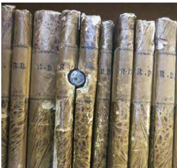
Rathaus Staufen. 24. September 1848. Gewehrku­gel im Großherzoglichen Amtsblatt.

Reich an Erinnerungen an die Revolutionszeit hat Schopfheim auch ein modernes Denkmal zu bieten: die Großplastik des Bildhauers Peter Lenk mit dem Titel „Badische Revolution“ von 2004, die auf revolutionärer Seite neben Friedrich Hecker und Gustav Struve auch Emma Herwegh in anzüglicher Pose und Fritz Teufel, den Gründer der „Kommune 1“ darstellt, denen Soldaten mit dem Gesicht des ehemaligen Ministerpräsidenten Erwin Teufel gegenüberstehen – ein bis heute nicht unumstrittener Blickfang auf dem Marktplatz.