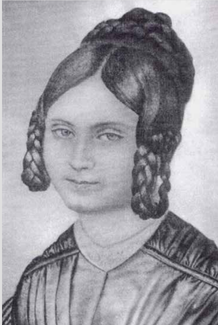
Portrait Mathilde Franziska Anneke

Zum 200. Geburtstag von Mathilde Franziska Anneke (1817 – 1884)