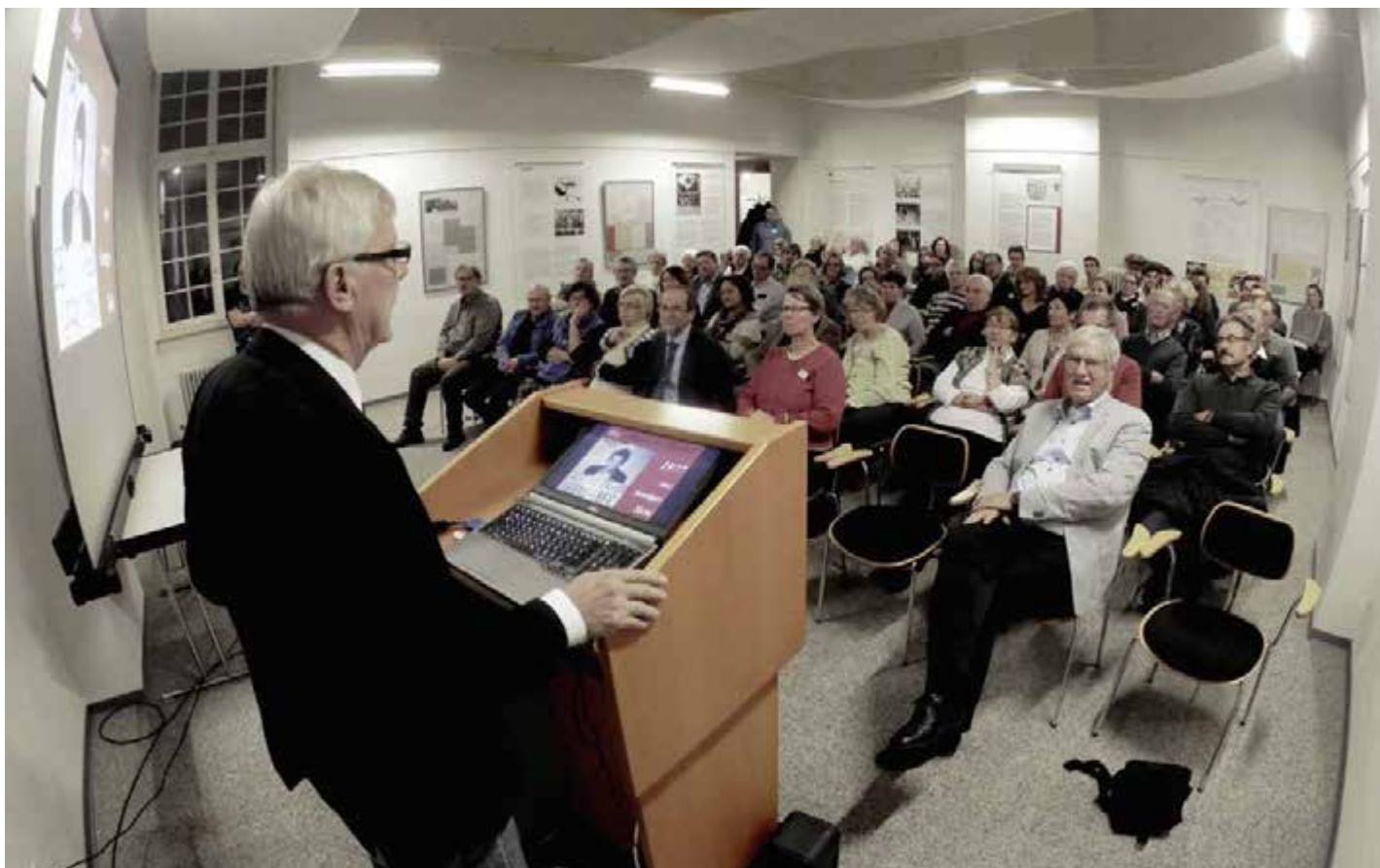
Zur Ausstellungseröffnung hatte das Bundesarchiv den ehemaligen Generalstaatsanwalt Klaus Pflieger eingeladen.