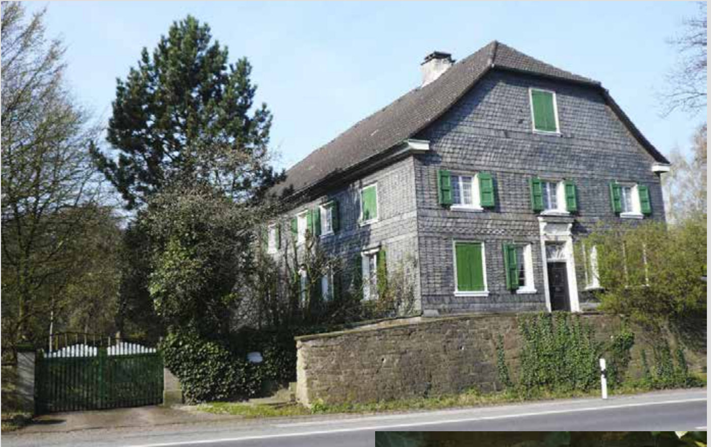
Geburtshaus von M. F. Anneke in Sprockhövel.