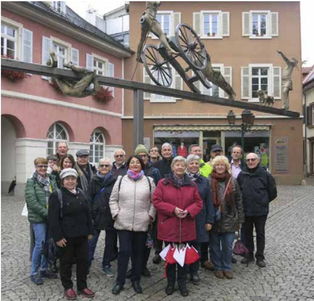
Unter dem Revolutionsdenkmal in Schopfheim.