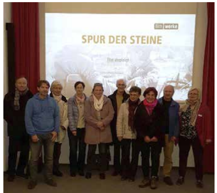
Die ersten Schlosskino-Besucher 2017 äußerten sich lobend über die neue Film- und Tontechnik.

Seit 2015 lädt die Erinnerungsstätte wieder regelmäßig zu Filmvorführungen ein. Das „Schlosskino“ wird sehr gut angenommen.