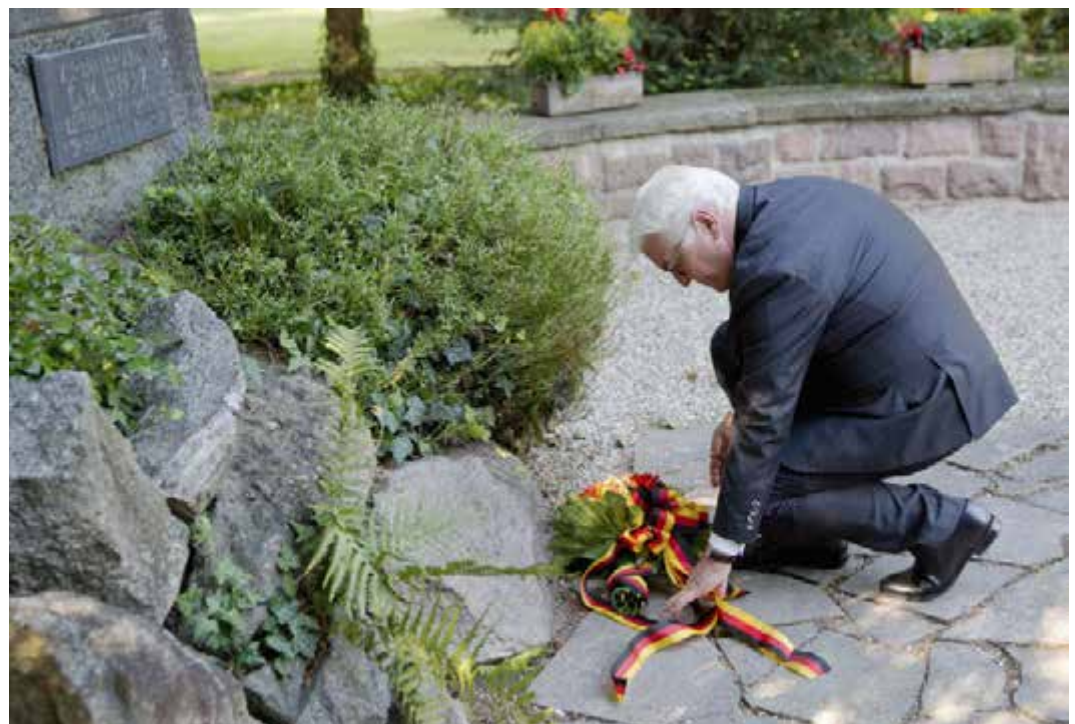
Gedenken an die Opfer – Bundespräsident Frank-Walter Steinmeier am Denkmal für die 1849 standrechtlich Erschossenen im Patientengarten des Klinikums Rastatt.