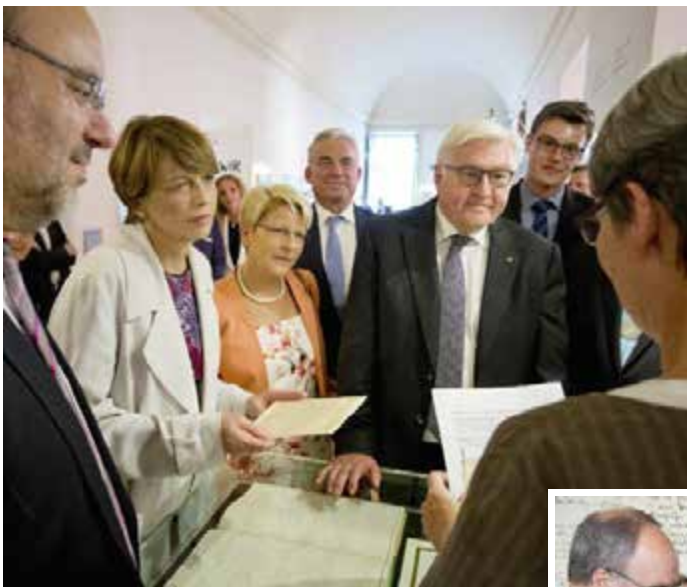
Die Gäste vor der Vitrine mit dem „Schwarzen Buch“.

Die wichtigsten Passagen können in einem Faksimile nachgelesen werden. Ausnahmsweise im Original sehen die Gäste Briefe von Gustav W. Heinemann, in denen er die Einrichtung einer Erinnerungsstätte für die demokratischen Bewegungen in der deutschen Geschichte vorschlägt. Nach meinem Eindruck haben die Schriftstücke aus dem 19. Jahrhundert und aus der Akte aus dem Bundespräsidialamt Eindruck auf die Gäste gemacht.