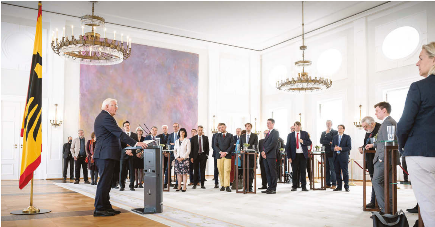
Empfang für die Teilnehmer*innen der Jahrestagung der Arbeitsgemeinschaft „Orte der Demokratiegeschichte“ am 8. Oktober 2021 in Schloss Bellevue

Rede beim Empfang am 8. Oktober 2021 in Schloss Bellevue