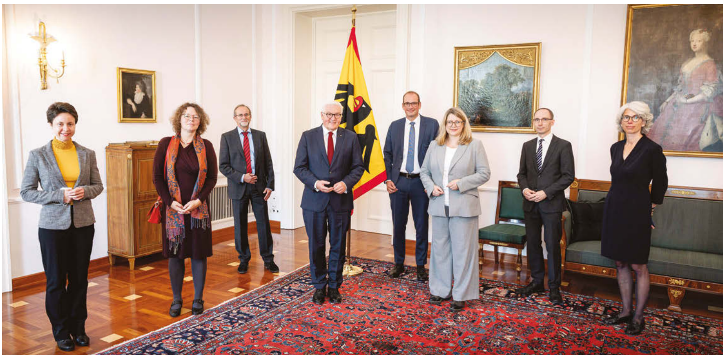
Der Sprecher*innenrat der AG Orte der Demokratieggeschichte mit dem Bundespräsidenten Frank-Walter Steinmeier