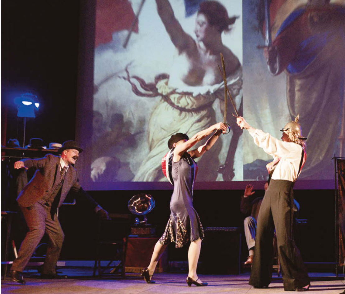
Axensprung zu Gast im Bundesarchiv mit ihrem Stück „Gier“ – vor kurzem wurde das Stück von der renommierten Theaterzeitschrift „Die Deutsche Bühne“ zum besten Stück des Jahres 2019 in der Rubrik „Freie Szene“ gewählt