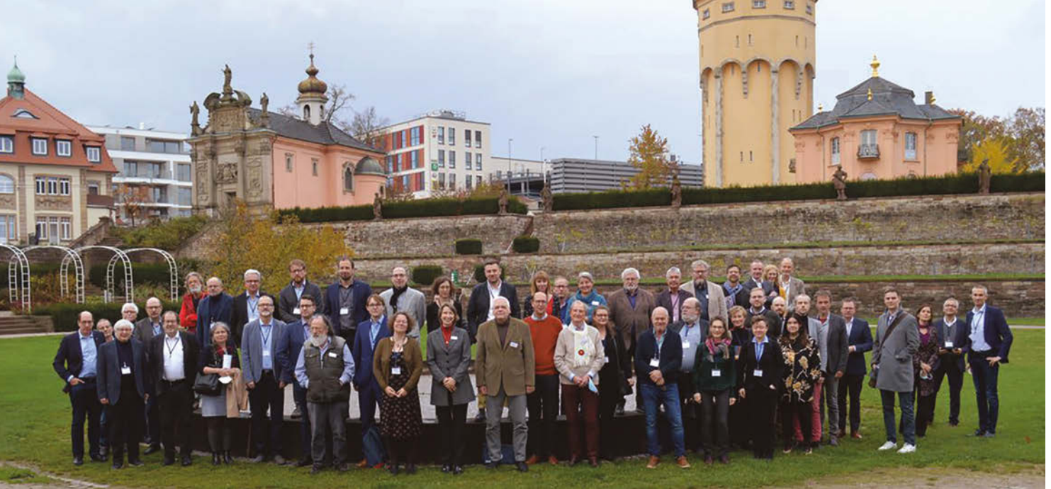
Teilnehmer*innen der Auftakttagung des Jubiläumsnetzwerks „175 Jahre Revolution 1848/49“ in Rastatt