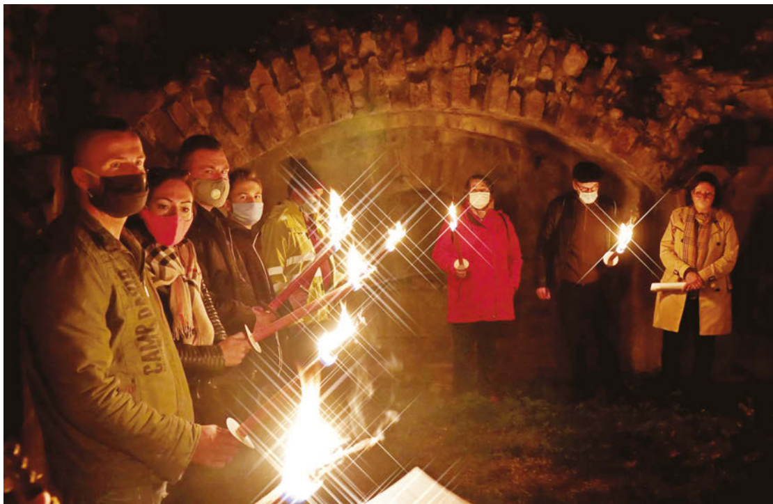
Gedenken am Originalschauplatz