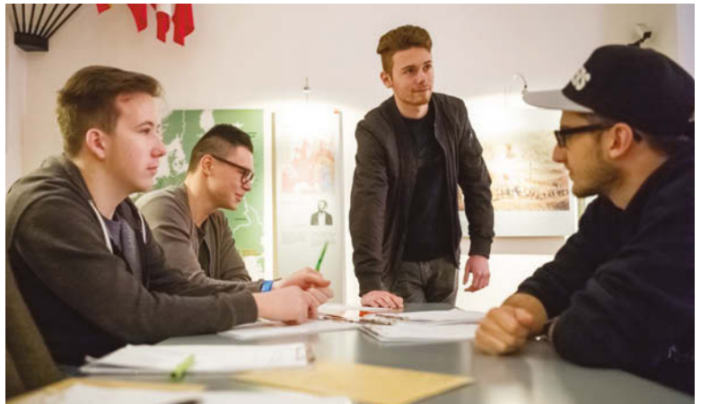
Schülerprojektarbeit in der Bundesarchiv-Erinnerungsstätte

Es hat uns im Sommer noch mit Hoffnung erfüllt, dass wir ab September 2021 mit den neuen Honorarverträgen wieder Führungen für Besucher*in-