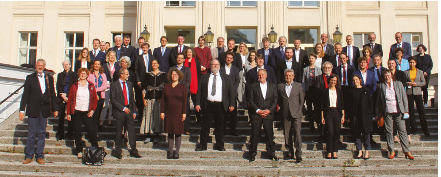
Gruppenfoto von Mitgliedern der AG „Orte der Demokratiegeschichte“

Neuer Sprecher*innenrat gewählt – Empfang beim Bundespräsidenten