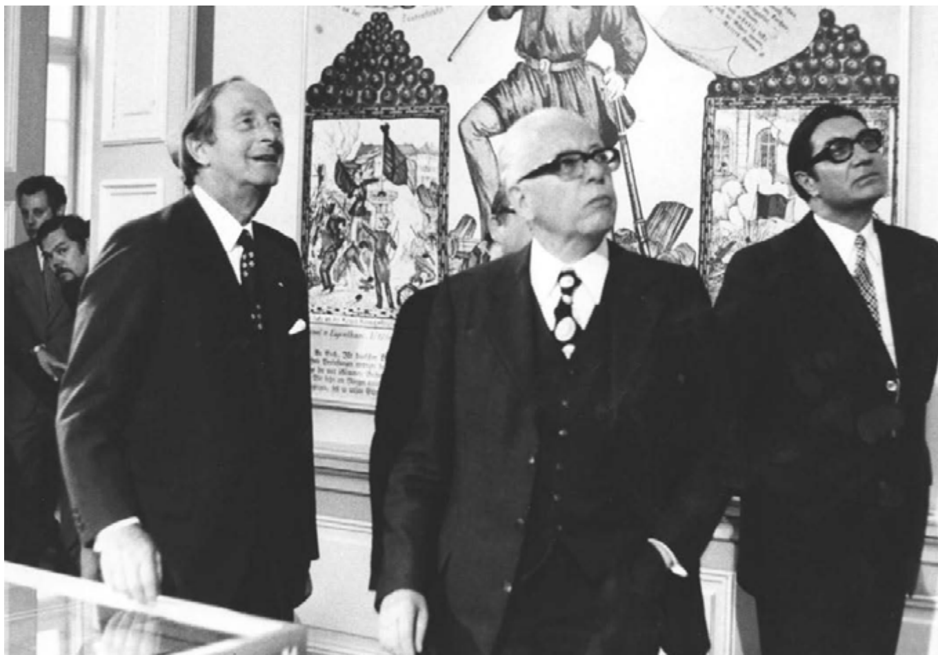
Bundespräsident Gustav Heinemann, der baden-württembergische Ministerpräsident Hans Filbinger und Bundesminister des Innern, Werner Maihofer beim Rundgang durch die Erinnerungsstätte