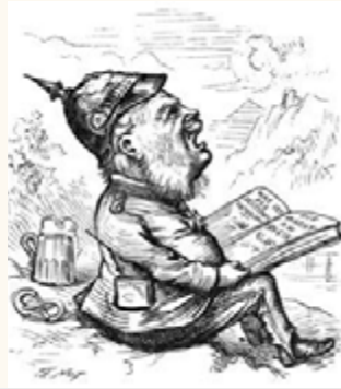
Kaiser Wilhelm I.