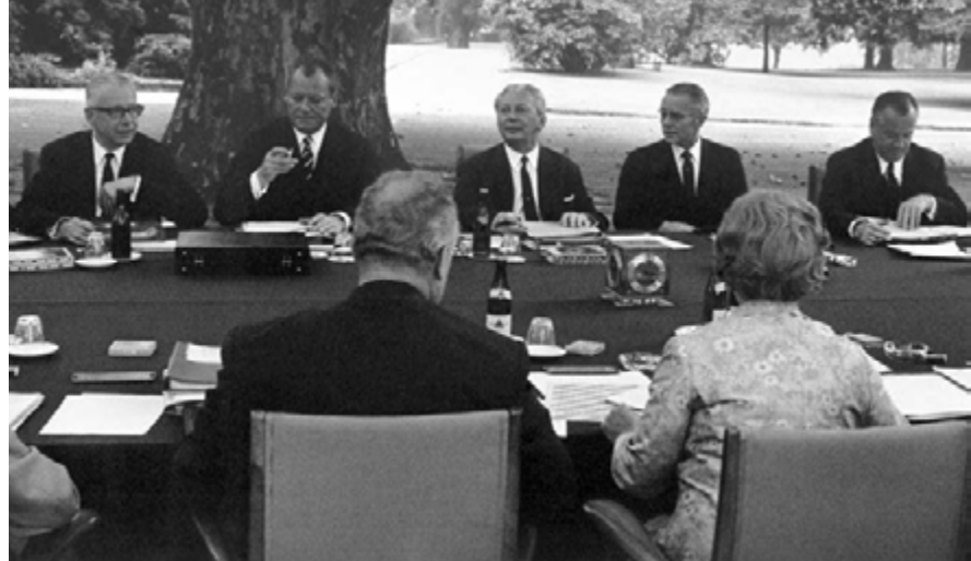
1967: Heinemann (hinten links) bei einer Kabinettsitzung der Großen Koalition mit Bundeskanzler Kurt Georg Kiesinger (Mitte) im Park des Palais Schaumburg

Heinemanns besonderes Interesse galt der Friedenspolitik nach innen und nach außen. Als Bundespräsident setzte er sich intensiv für den zivilen