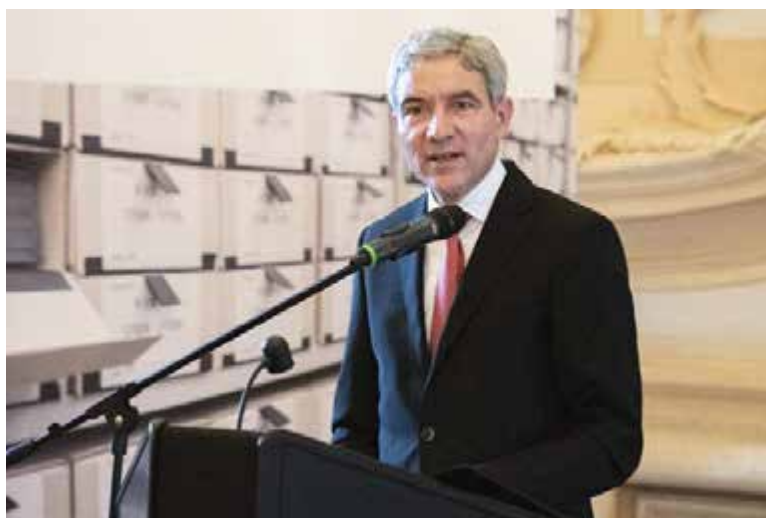
Der Präsident des Bundesverfassungsgerichts, Stephan Harbarth, beeindruckte mit einer programmatischen Rede