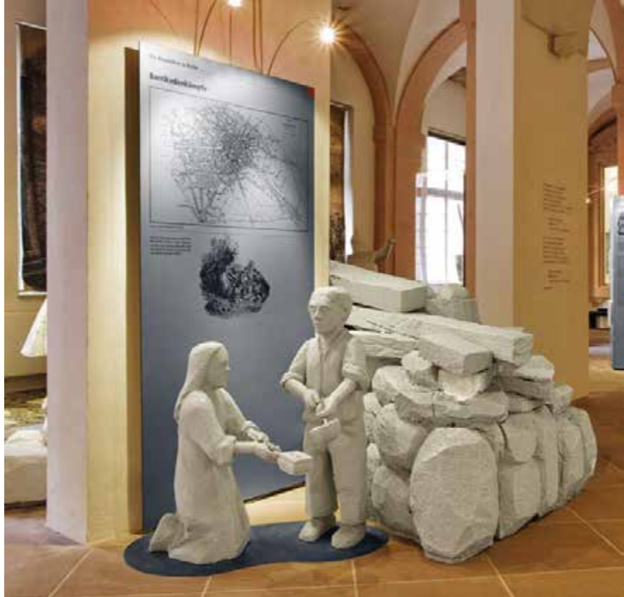
Mit der Neukonzeption 1999 halten Objekte und Inszenierungen Einzug in die Dauerausstellung