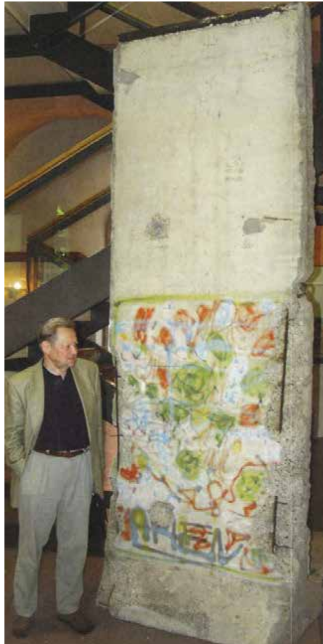
2001: Der ehemalige SED-Funktionär Günter Schabowski, der am Abend des 9. November 1989 die ungeplante Öffnung der Grenze zwischen DDR und Bundesrepublik verursachte, mit einem Stück der Berliner Mauer in der Erinnerungsstätte