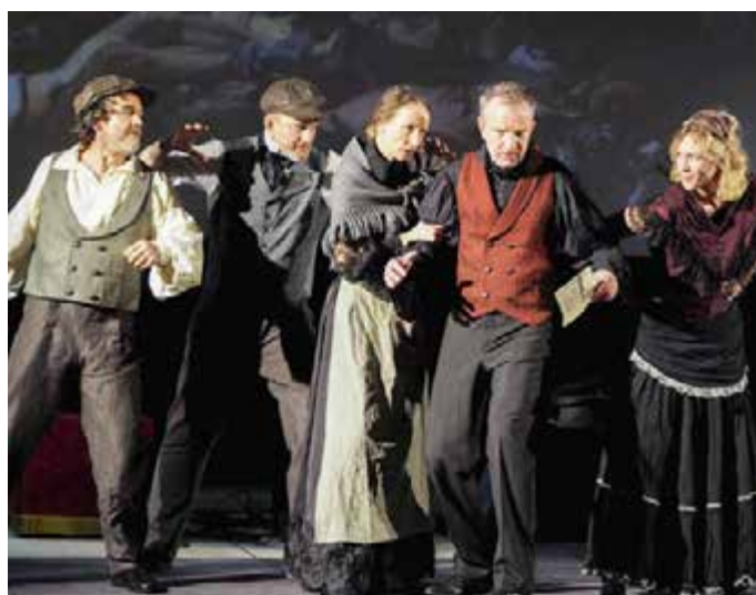
2023: Zum 175. Jubiläum der Revolution entsteht im Auftrag der Erinnerungsstätte das Theaterstück „Freiheit! 1848“ des Theater Axensprung, das auf Bühnen in ganz Deutschland zu Gast ist