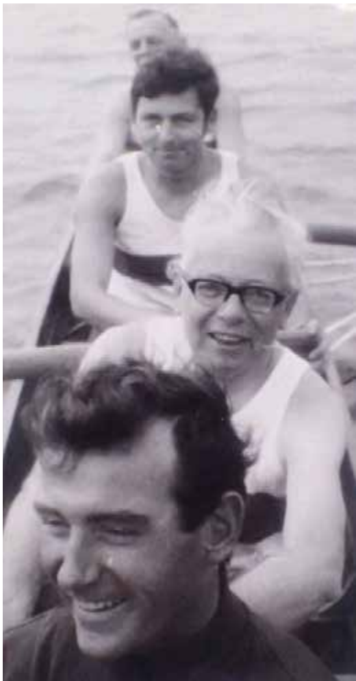
Auf Position 3 griff Bundespräsident Gustav Heinemann auf dem Goldkanal 1970 in den Riemen

„Ausfahrt mit Herrn Bundespräsident Heinemann“, ist unter „Bemerkungen“ im alten RCR-Fahrtenbuch festgehalten. Außerdem ist das Schmankerl durch vorhandene Fotos nachvollziehbar. So blieb die Stadt an der Murg nicht nur wegen des historischen Bezugs, sondern auch wegen einer besonderen sportlichen Aktivität in Erinnerung.