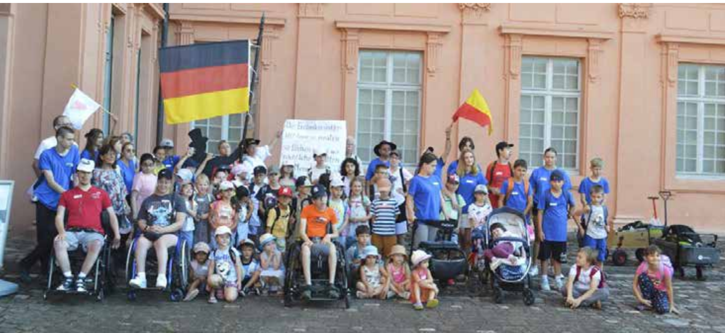
Die Teilnehmenden der Inklusions-Ferienfreizeit vor dem Eingang des Revolutionsmuseums auf dem Ehrenhof des Residenzschlosses Rastatt