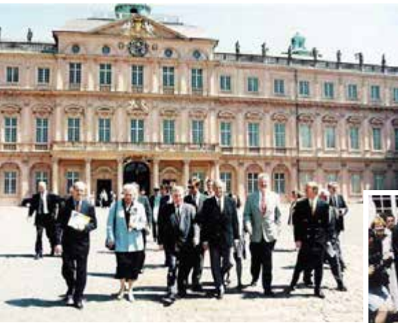
1998: Der ehemalige polnische Staatspräsident, Friedensnobelpreisträger und Gründer der Gewerkschaftsbewegung „Solidarność“, Lech Wałęsa, besucht die Erinnerungsstätte