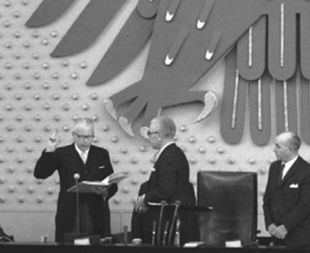
Juli 1969: Heinemann wird als erster Sozialdemokrat zum Präsidenten der Bundesrepublik Deutschland vereidigt