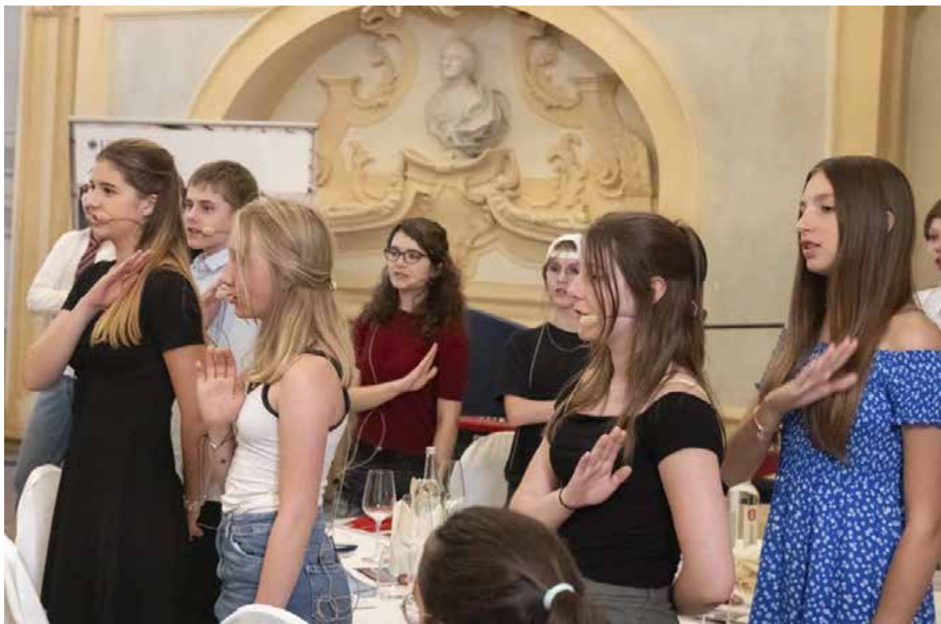
Die Theater-AG des Rastatter Tulla-Gymnasiums spielte Szenen aus Morton Rhues Bühnenstück „Die Welle“