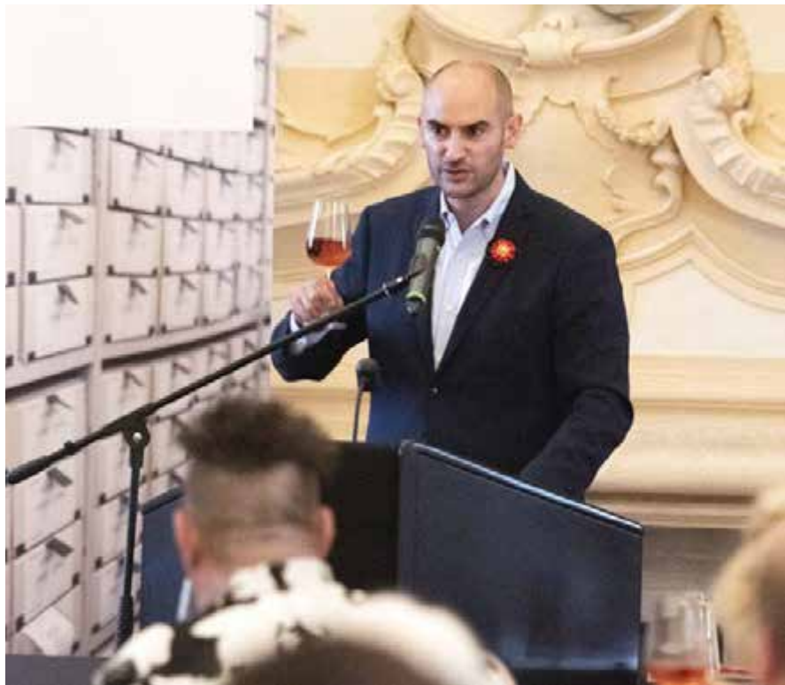
Einen mitreißenden Toast auf die Erinnerungsstätte und die Demokratie überbrachte Danyal Bayaz, der Finanzminister des Landes Baden-Württemberg

Dabei können wir demokratiehistorisch auch auf ganz andere Ereignisse blicken. Und damit auf eine positive Seite deutscher Geschichte. Die Erinnerungsstätte im Schloss Rastatt leistet ihren Beitrag dazu. Das geht unter die Haut, wenn man sie be-