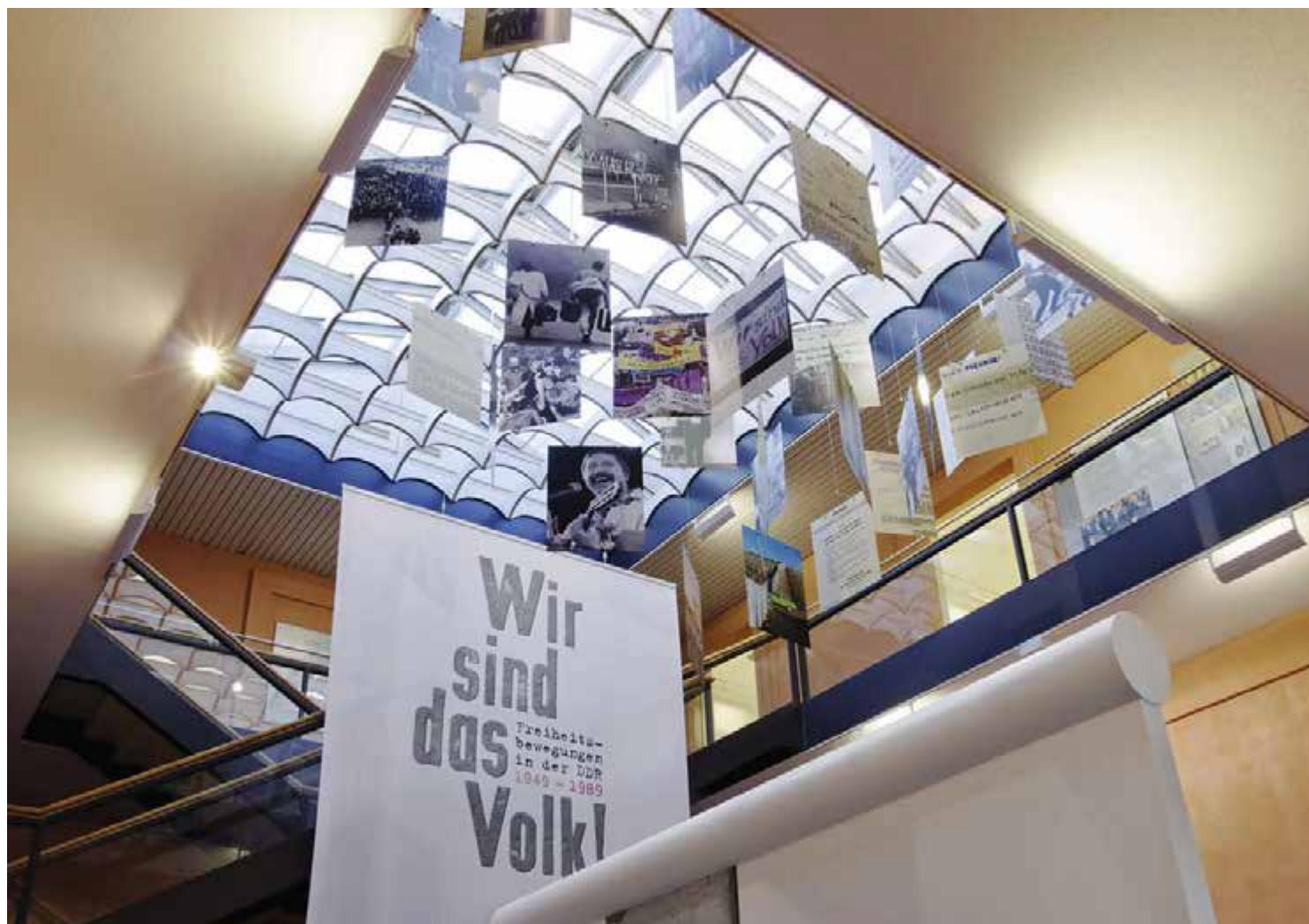
Die letzte größere Überarbeitung erfolgte 2009 mit dem neuen Dauerausstellungsteil „Freiheitsbewegungen in der DDR“