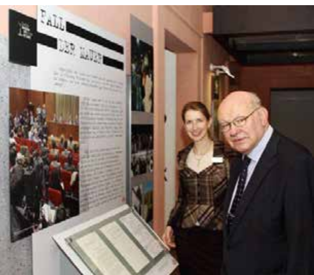
2014: Elisabeth Thalhofer führt den ehemaligen Regierenden Bürgermeister von Berlin, Walter Momper, durch die Ausstellung