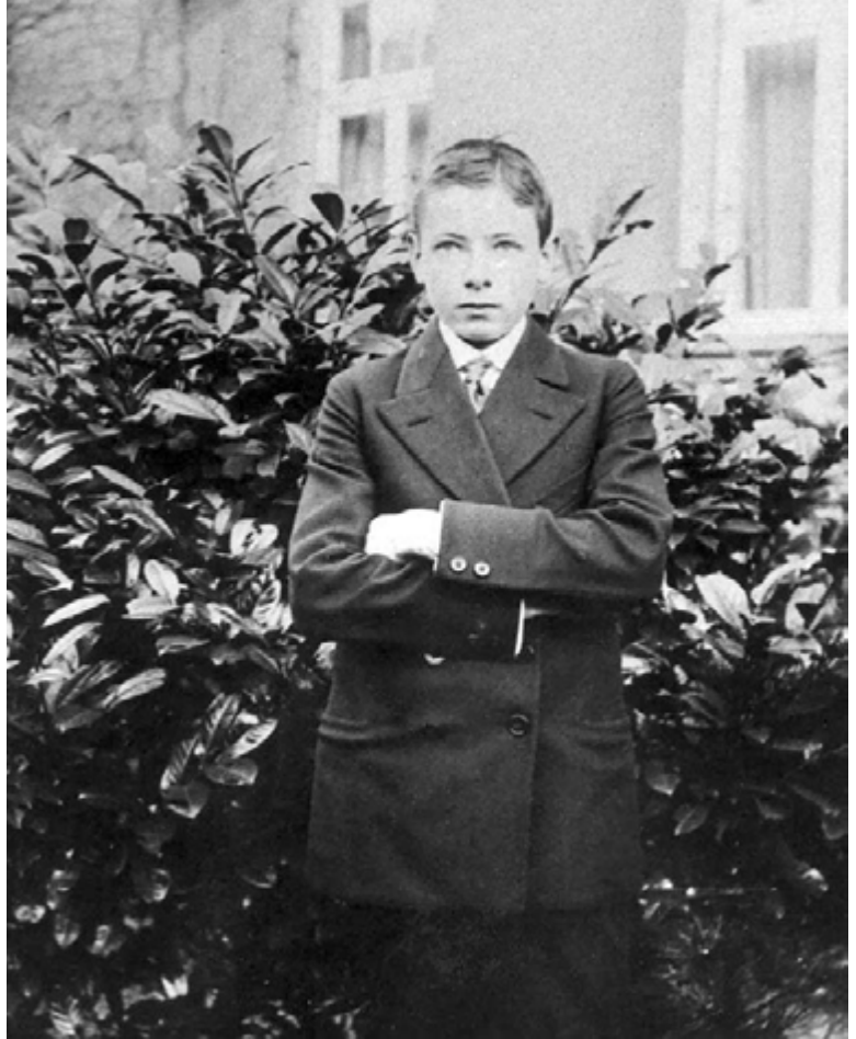
Gustav Heinemann interessiert sich schon als junger Mann für die Teilnahme seiner Vorfahren an der Revolution von 1848/49