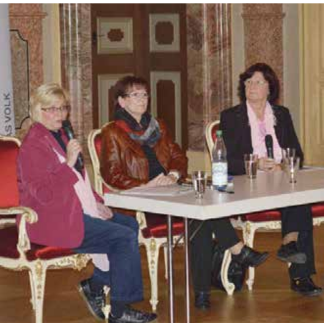
Beim Zeitzeugengespräch über das DDR-Gefängnis von Hoheneck, 2013