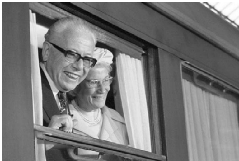
Juli 1974: Abschied aus Bonn