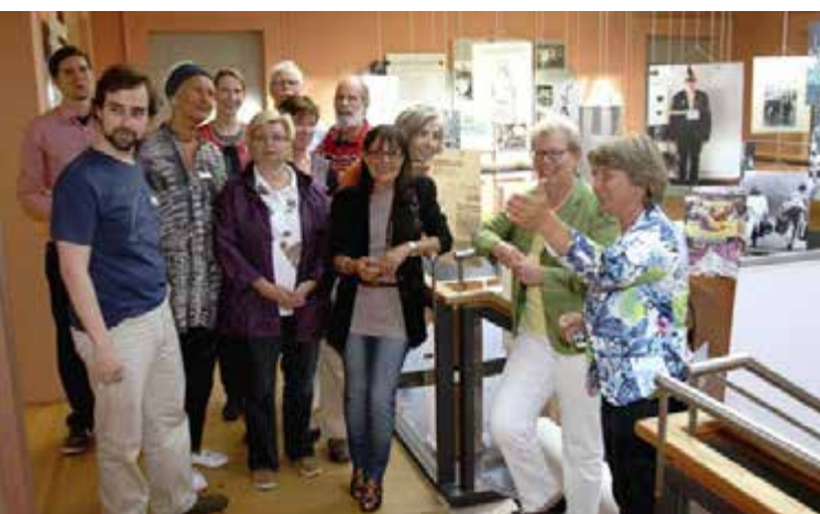
2013: Museumspädagogische Fortbildung mit den Geschichtsvermittlerinnen und -vermittlern