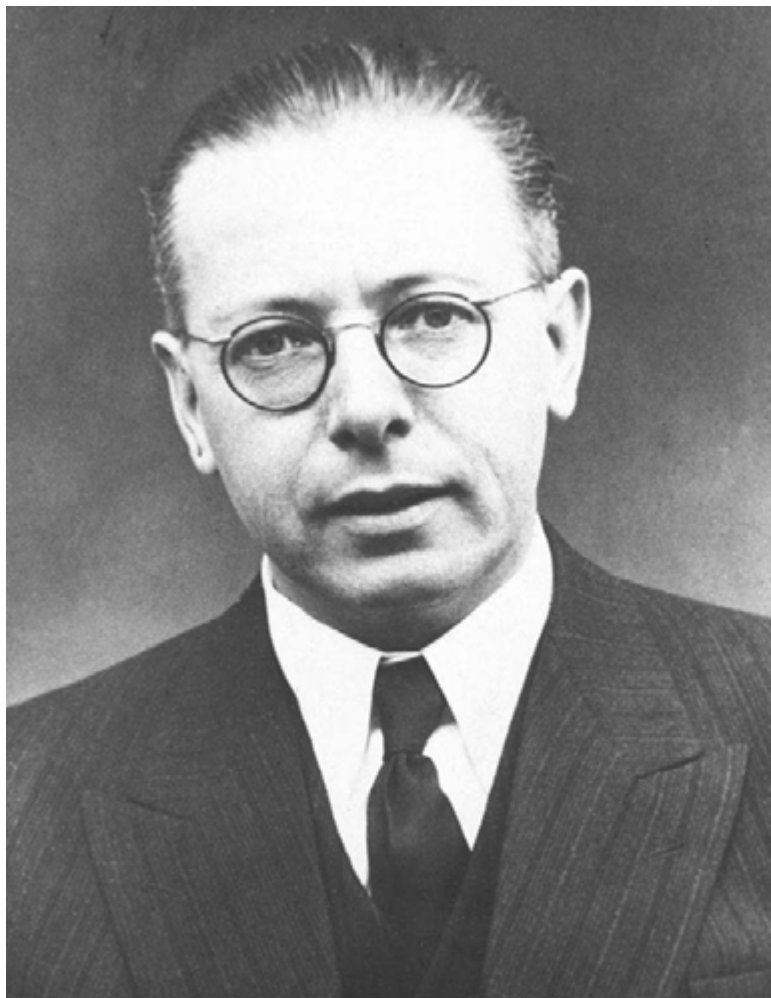
1949: Nach dem Zweiten Weltkrieg wird Gustav Heinemann Innenminister im ersten Kabinett von Bundeskanzler Konrad Adenauer