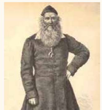
Friedrich Ludwig Jahn