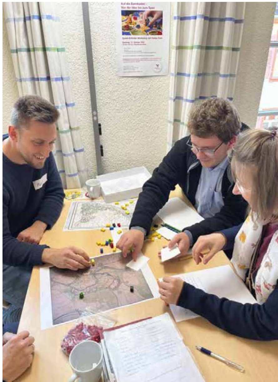
Geschichte einmal anders: beim Spieleerfinder-Workshop stand die Revolution von 1848/49 im Mittelpunkt

Die allesamt brettspielbegeisterten und -erfahrenen Teilnehmerinnen und Teilnehmer tüftelten in Kleingruppen Spieleideen zum Thema „175 Jahre Badische Revolution“ aus und diskutierten, welche Spielmechanismen sich gut zur Umsetzung des Themas eignen. Dass hier Brettspielkennerinnen und Brettspielkenner am Werk waren, zeigten die Er-