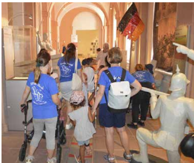
Kinder und Jugendliche der Inklusions-Ferienfreizeit erkunden den „Barrikadenraum“ des Revolutionsmuseums