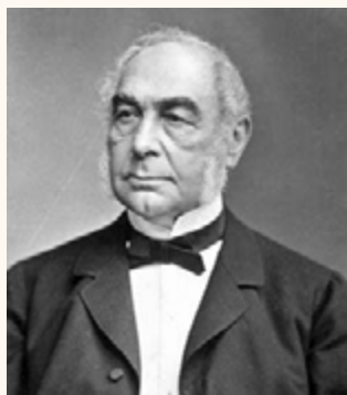
Eduard von Simson