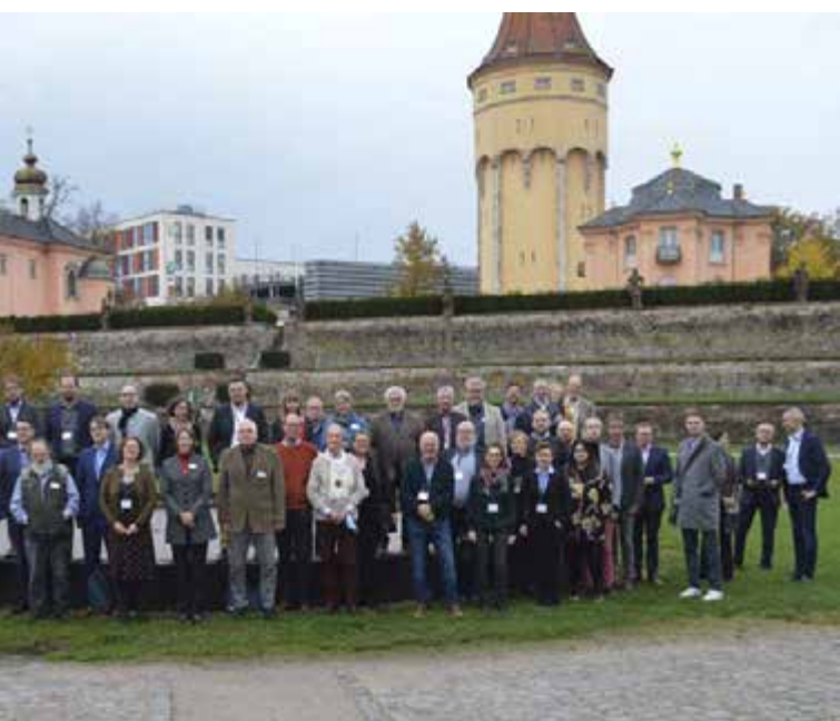
2021: Das Jubiläumsnetzwerk "175 Jahre Revolution 1848/49" trifft sich zur Auftakttagung in Rastatt