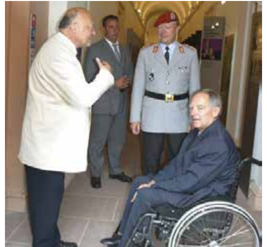
2003: Bei einer Veranstaltung mit Bundeswehrsoldaten ist der Bundestagsabgeordnete Wolfgang Schäuble (r.) zugegen