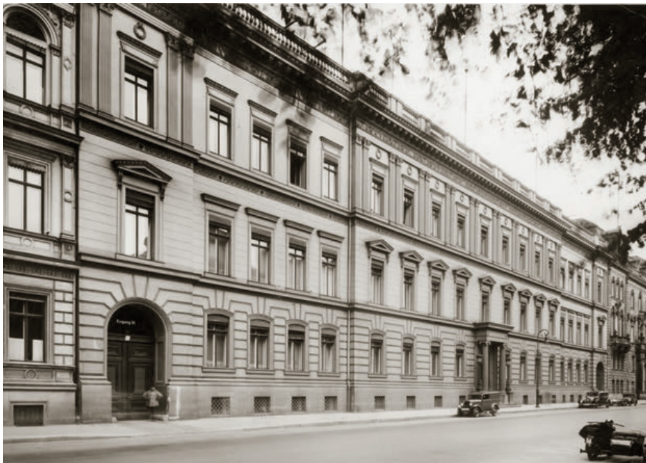
Gebäude des Reichsjustizministeriums in Berlin, 1938

Öffentlichkeit, und wir haben diese Öffentlichkeit immer auch selbst gesucht. Unser Ziel ist es, die Erinnerung dem Vergessen entgegenzusetzen. Natürlich wird es am Ende auch einen Abschlussbericht geben. Das Buch soll 2016 vorliegen. In mehreren Folgebänden werden anschließend in einer eigenen „Rosenburg-Reihe“ einzelne Aspekte weiter vertieft. Wir hoffen,