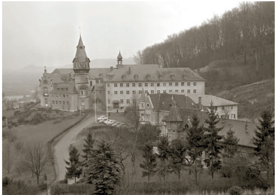
Gebäude des Bundesministeriums der Justiz in Bonn („Rosenburg“), 1958

lizistin Hannah Arendt hat dazu einmal die gängige Formel geprägt, „das Vergangene sei noch unbewältigt“, und bemerkt: „Das Höchste, was man erreichen kann, ist zu wissen und auszuhalten, dass es so und nicht anders gewesen ist, und dann zu sehen und abzuwarten, was sich daraus ergibt.“ Es ist deshalb unsere Verantwortung, an die Geschehnisse der Vergangenheit zu erinnern, sie wach zu halten und daraus Lehren für die Gegenwart und die Zukunft zu ziehen. Wir wis-